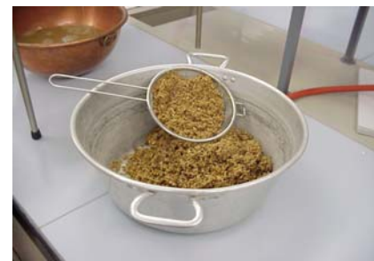
Der zurückgebliebene Malzschrot