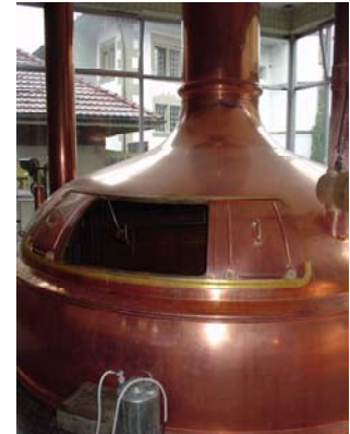
Der Läuterbottich in der Brauerei von Eggerbier in Worb

Unter Abläutern versteht man das Trennen der Dickmaische in den flüssigen Teil, die sogenannte Würze und den festen Teil, den Treber. Dies wird durch eine Filtration erreicht. Brauereien setzen meist einen Läuterbottich ein. Dabei bilden die Treber eine natürliche Filterschicht. Der Treber wird mit 80°C heissem Wasser nachgewaschen wodurch die restlichen wichtigen Bestandteile extrahiert werden. Der gewaschene Treber kann zu Brot verarbeitet werden oder er wird als Tierfutter verwendet.