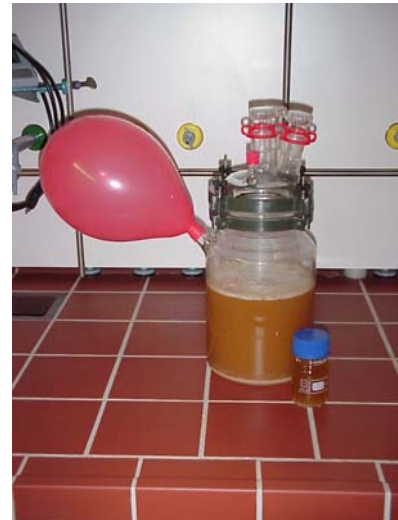
„Und äs gäret“ Reaktionsgefäß mit Bier im Gärstadium