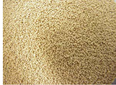
Trockenhefe, welche auch zur Produktion unseres Bieres verwendet wurde

Es gibt viele verschiedene Hefe-Arten, einige sind für Magenerkrankungen und Ekzeme verantwortlich, andere für den Wohlgeschmack alkoholischer Getränke und für das „Aufgehen“ des Brotes. Die Hefe ist zwischen 5-8 \mu\text{m} groß. Die Hefezellen können sowohl Kohlenstoff unter Sauerstoffverbrauch zu \text{CO}_2 oxidieren (aerobe Gärung) als auch Glucose unter \text{O}_2 -Ausschluss in \text{CO}_2 und Alkohol umwandeln. Die Verwendung von Sauerstoff ist pro Zuckermolekül energetisch günstiger als die Gärung. Deswegen vermehrt sich die Hefe in einer sauerstoffhaltigen Umgebung besser.