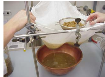
Filtration / Abmaischen