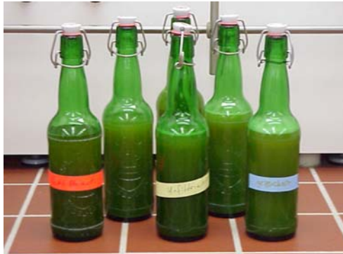
Unsere verschiedenen Biersorten

Nach dieser Gärzeit wurde das Bier wie folgt in diverse Flaschen abgefüllt: