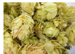
Hopfen in Dolden-(oben) und in Pellets-Form (unten)

Das Mass für die Bitterwirkung im Hopfen ist der \alpha -Säuregehalt. Man unterscheidet die Hopfensorten in Bitterstoff- mit hohem \alpha -Gehalt und Aromahopfen mit hohem Anteil an aromatisierend wirkenden Hopfenölen.